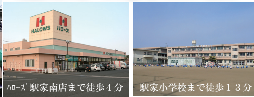
ハローズ 駅家南店まで徒歩4分 駅家小学校まで徒歩13分