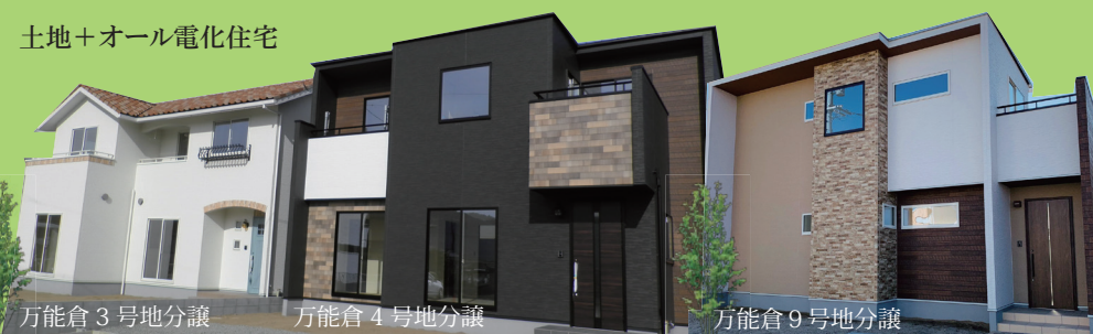
万能倉3号地分譲 万能倉4号地分譲 万能倉9号地分譲