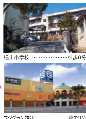
フジグラン神辺 ……車で3分