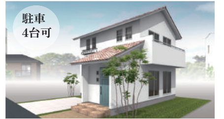
【新漕町6丁目⑥・新築分譲住宅】