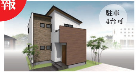
【新漕町6丁目⑤・新築分譲住宅】