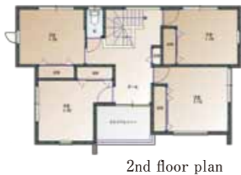
2nd floor plan