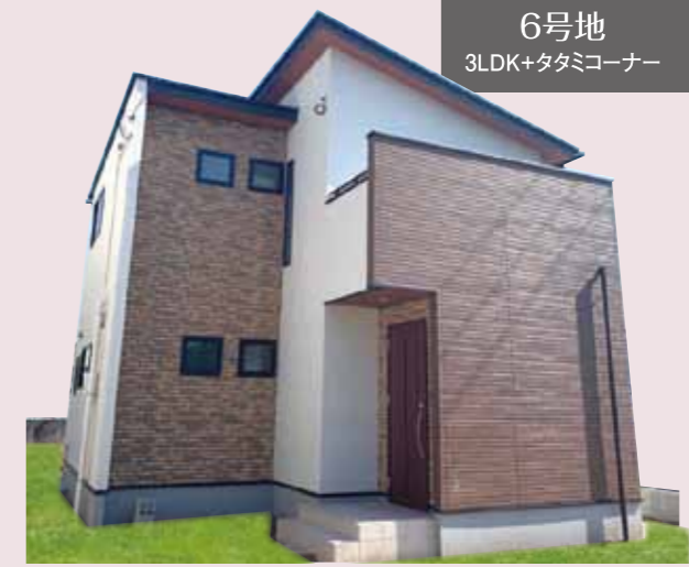
6号地 3LDK+タタミコーナー

3,025 (税込)万円 ○土地面積 / 140.65㎡ (42.54坪) ○建物面積 / 92.33㎡ (27.92坪)