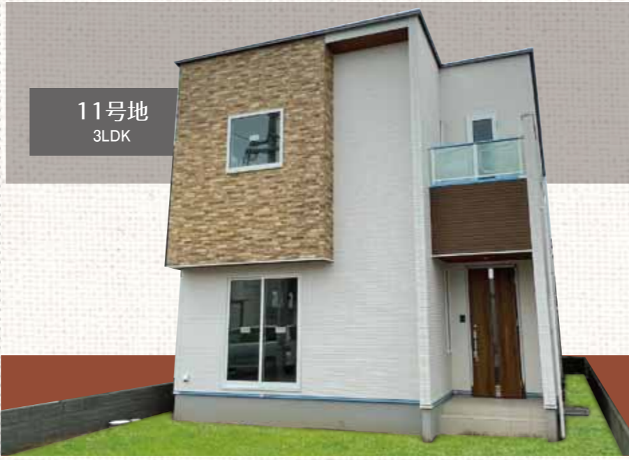
～遊ぶ・多目的にホールのある家～